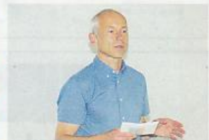
Der Präsident Jürg Eggerschwiler informierte über die Tätigkeiten der LA Nidwalden