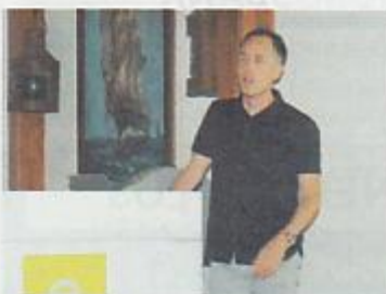
Viktor Röthlin hielt seine Zuhörer beim Referat im Bann

Die Vereinigung, die sich zum Ziel gesetzt hat, erfolgreiche Nidwaldner Leichtathletinnen und Leichtathleten mit Fördergeldern zu unterstützen, konnte in diesem Jahr insgesamt drei Leichtathleten und zwei Leichtathletinnen unterstützen und ihnen einen Geldbetrag überreichen. Diese Beiträge sollen den Athleten und Athletinnen helfen, die Unkosten zu begleichen, die eine konsequente Leistungssportkarriere beinhalten. Denn die Kosten für persönliche Trainer und sportmedizinische Unterstützungen müssen sie meistens selber berappen.